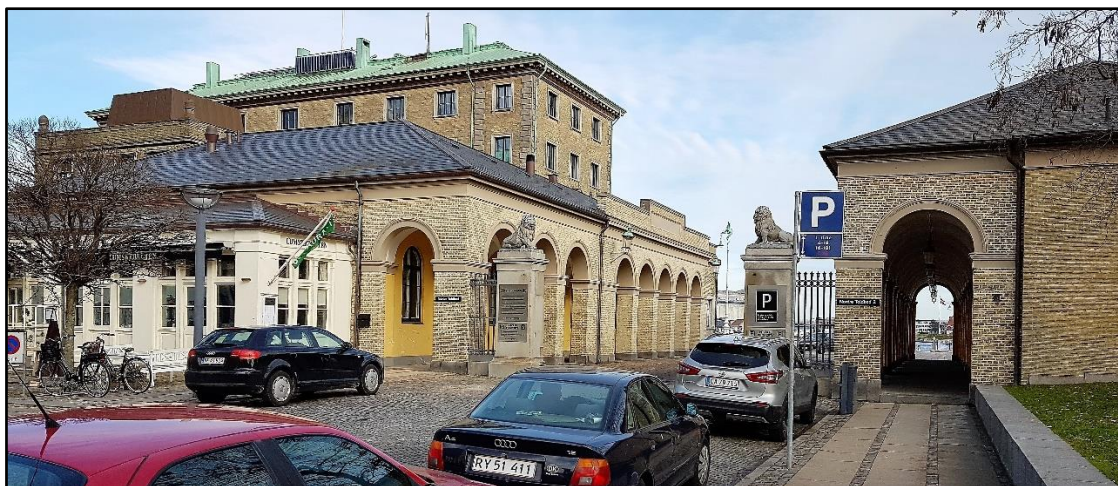
Nordre Toldbod med A. P. Møller museet

Efter at have drukket morgenkaffe går vi over til museet som ligger ca. 100 meter fra Cafe Toldboden vis a vis A. P. Møller.