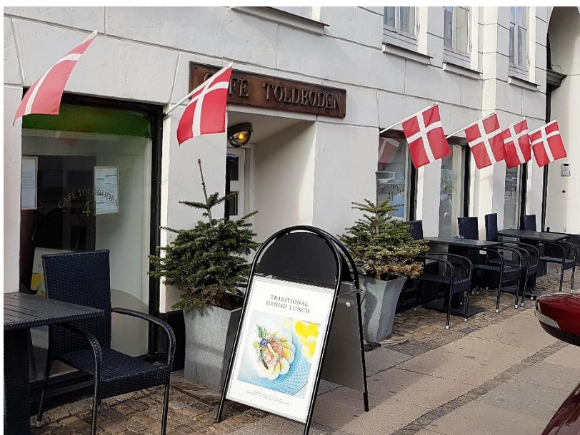
Cafe Toldboden, Amaliegade 41, 1256 København K

Vi mødes på Cafe Toldboden kl. 10:00 til en kop morgenkaffe og et rundstykke med pålæg. Fra Hovedbanen kan man med fordel tage bus 1A til krydset Esplanaden/Bredgade, herfra er der ca. 450 meters gang til Cafe Toldboden. Man kan også tage tog/S-tog til Østerport, herfra er der ca. 1 km. at gå. Parkeringsforholdene er vanskelige hvis man kommer i bil da det kan være meget svært at finde pladser, og parkeringsvagterne er meget aktive.