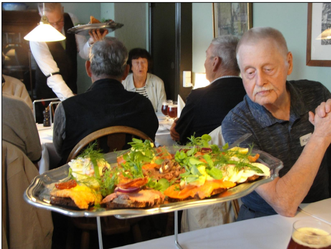
Udvalget tages i øjesyn

Her var bestilt 2 stykker smørrebrød samt en øl/vand/vin til alle. 2 stykker kan måske lyde af lidt, men det var nogle rigtig store og lækre stykker, og der blev faktisk levnet, så det må jo have været nok.