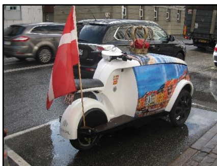
Cafe Toldbodens vartegn