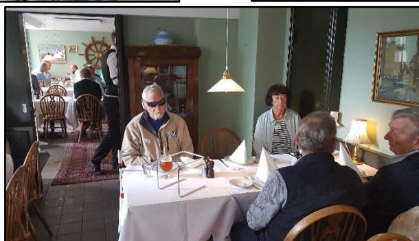
Morgenkaffe på Cafe Toldboden