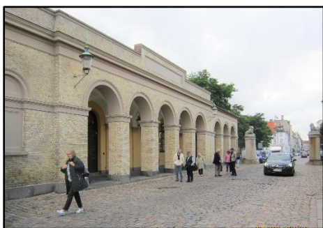
Nordre Toldbod med kolonnaden og museet

Der var tilmeldt 21 deltagere, desværre måtte Henrik melde fra pga. dødsfald i familien, så vi blev 20, lidt flere end de foregående år.