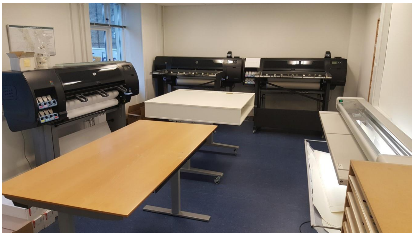
POD – print on demand rummet hos Weilbach i København

som det vigtigste. I starten var det en opgave der krævede et stort lager af søkort samt en væsentlig arbejdsbyrde idet samtlige kort der lå på lager skulle rettes ugentlig iht. Notice to mariners (efter 2. verdenskrig kom en inspektør på besøg fra UK, han kasserede samtlige kort der var på lager da de jo ikke var blevet rettet de sidste fem år). Leverance til en nybygning der skulle i Worldwide fart kunne sagtens løbe op i 1500 kort. I dag foregår det på en noget nemmere måde. Brugen af papirkort er efterhånden blevet meget begrænset med ibrugtagningen af de digitale navigationssystemer. Weilbach har POD licens (print on demand) til kort fra Admiralty Charts(UK), NOAA(USA), NGA(USA) og Kartverket(Norge). Når et fartøj bestiller et papirkort henter Weilbach eller en af afdelingerne en fil med det pågældende kort oprettet til printtidspunktet, derefter printer man kortet ud og leverer det til skibet.