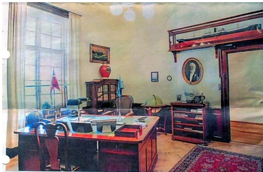
Skibsreder A.P. Møllers kontor er gemt på præcis som det så ud i 1962, da A.P. Møller døde.

Foreløbig arbejdes der på muligheden af at få adgang til "Esplanadens hemmelige Mærsk-museum".